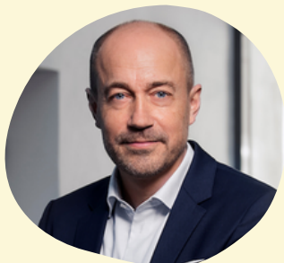
Magnus Heunicke Ligestillingminister Taler